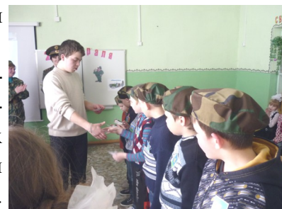
Родители учащихся 4 класса

Мероприятие прошло в веселой и незаурядной обстановке, все присутствующие получили заряд праздничного настроения. Хочется поблагодарить классных руководителей начальных классов за организацию мероприятия. Постараемся в будущем быть постоянными гостями и участниками всех школьных дел. Спасибо!